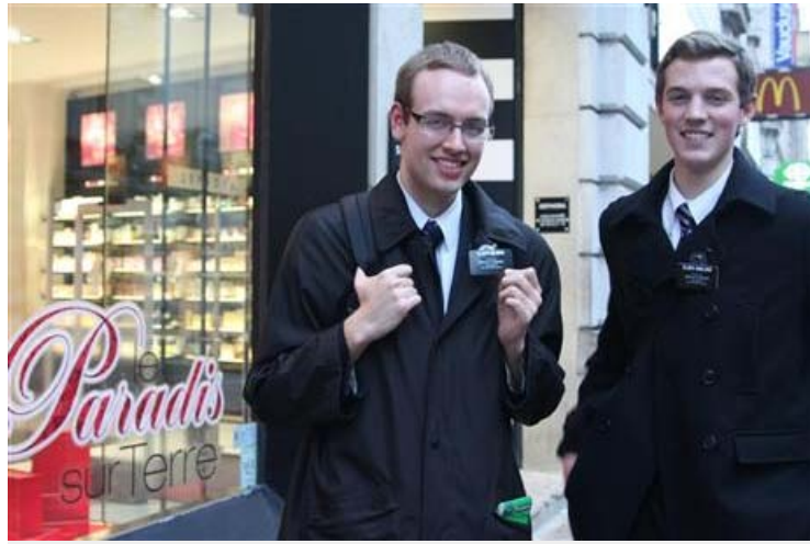
Les deux Elder sont missionnaires dans le Vaucluse : ce n'est pas leur prénom, mais est un titre que l'on donne et qui marque leurs degrés de spiritualité