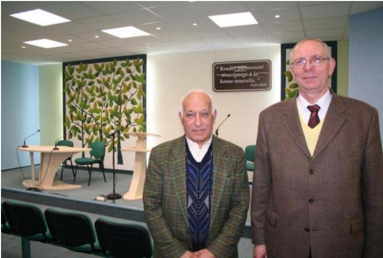
Les deux responsables des Témoins de Jéhovah de Lambres lez Douai